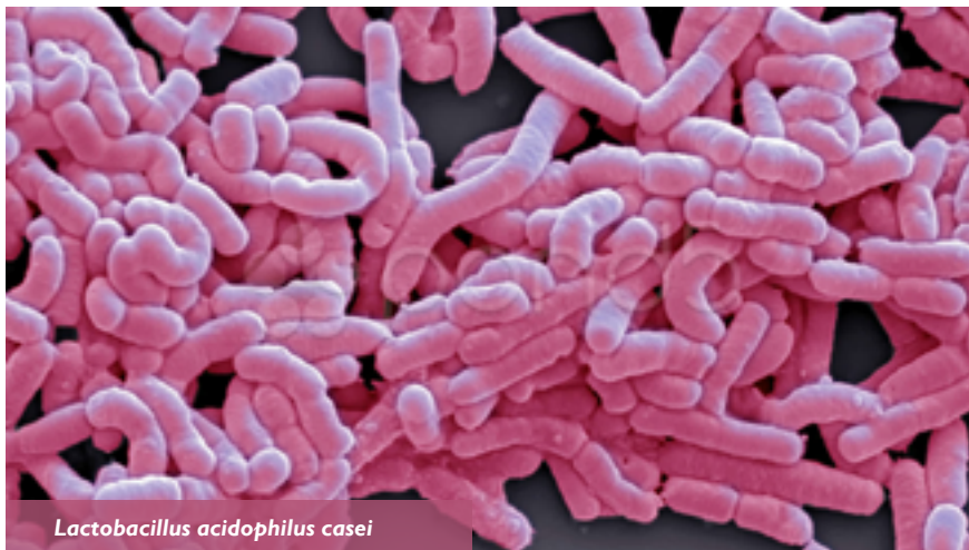
Lactobacillus acidophilus casei

São vários os efeitos benéficos atribuídos aos probióticos, entre os quais se destacam o efeito trópico na mucosa intestinal, hipocolesterolêmico, anticarcinogênico, tratamento e prevenção da diarreia e melhora da digestão da lactose.