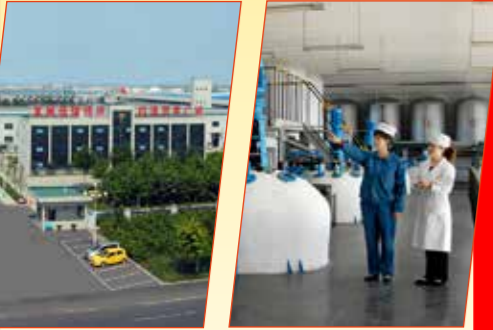
Um dos principais fabricantes mundiais de produtos à base de clorofila e vitamina K 1